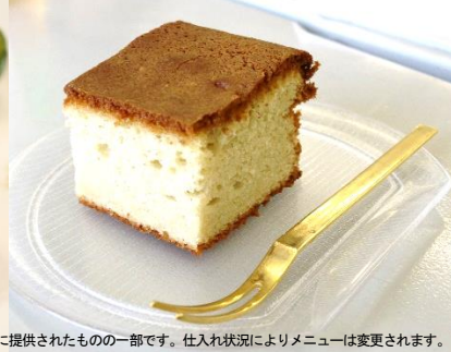
※写真は過去に提供されたものの一部です。仕入れ状況によりメニューは変更されます。