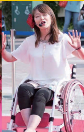
ビヨンドガールズ