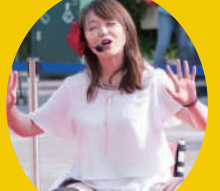
ビヨンドガールズ

「ちがいをたのしもう」を合言葉に障がいのイメージを覆し、自分たちの可能性を超え、チャレンジをしていく発信をしていこうと 2017 年 11 月に車いすチャレンジユニットとして結成。ステージ出演や講演、SNS での発信、企業との商品開発などを通し、車椅子や障害があるから無理だと思われる社会常識を変え、一歩を踏み出したい人のチャレンジを応援する活動を実施している。