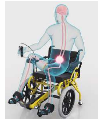
反応する原始的歩行中枢(イメージ図)

日本だけでなく、欧米でも認可取得済み アメリカ FDA (アメリカ食品医薬局) 認証、EU CE マーク取得、ベトナム社会主義共和国保健省医療認証 日本国内：福祉用具情報システム TAIS コード取得済み